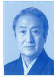
なかむらきんのすけ 中村錦之助