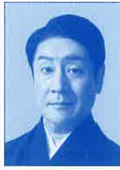
いちかわえみさぶろう 市川笑三郎